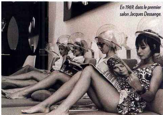
En 1969, dans le premier salon Jacques Dessange.